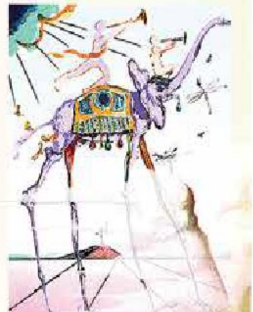
RECURRENCIAS. Los elefantes con extremidades alargadas aparecen de forma repetitiva en la obra de Dalí.

"Sabater pudo generar una serie de 20 fotografías que intituló El ojo invisible , basado en un libro que fue publicado en Barcelona, en 1992, que nos acercan a un Dalí real y desconocido, ya que es cariñoso con su mujer, vestido con ropa simple, que toma el sol en la playa,